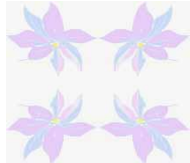
明るくぼかして背景の完成