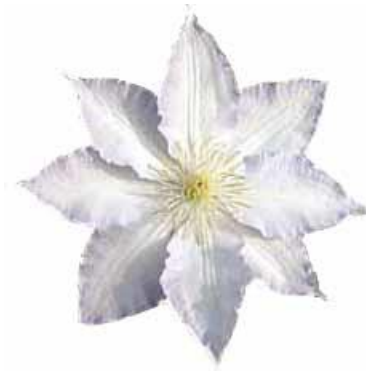
花だけを切り抜き