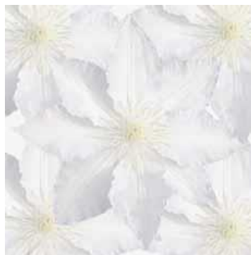
コピー・ペースト