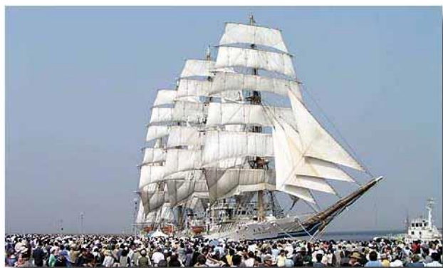
ウインドウ→エフェクト→ドロップシャドウ