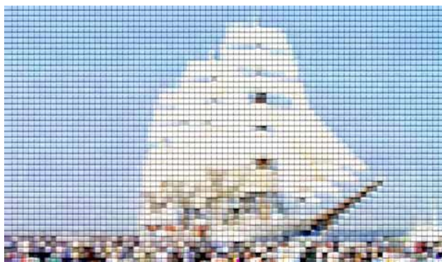
ウインドウ→フィルター→パッチワーク