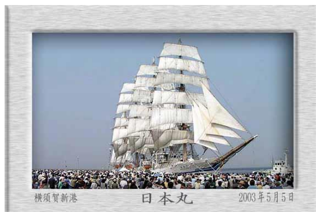
ウインドウ→エフェクト→つや消しアルミ