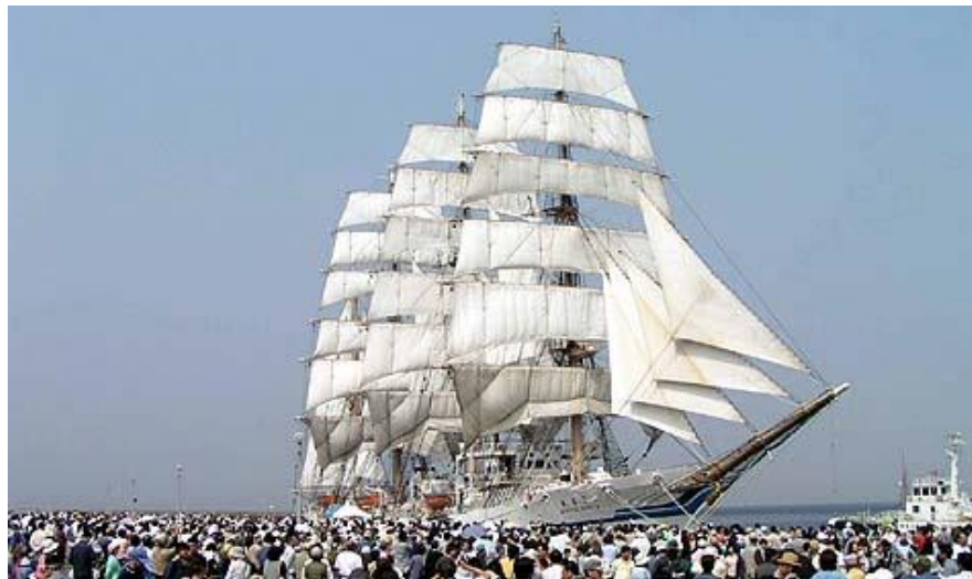
日本丸(横須賀新港 2003. 5. 5) オリジナル

オリジナルの写真を修飾するツールや効果をあげるツールをいろいろ試して見ましょう。